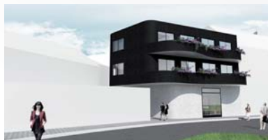
■ Jan Stašek SOŠ a Gymnázium Staré Město