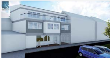
■ Lukáš Slezák SPŠS Valašské Meziříčí