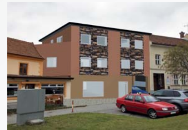
■ Ondřej Baletka SPŠS Valašské Meziříčí