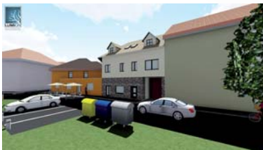
■ Zdeněk Vaculík SPŠS Valašské Meziříčí