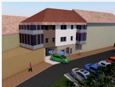
■ Tomáš Pospíšil SPŠS Valašské Meziříčí