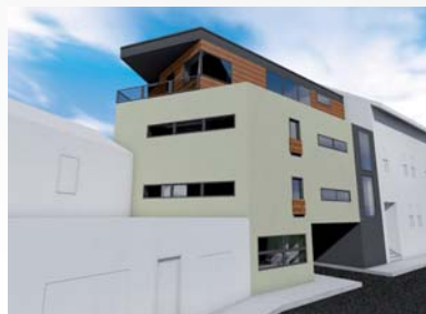
■ Tomáš Zálešák - SPŠ Zlín